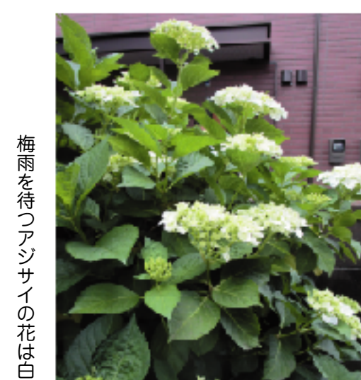
梅雨を待つアジサイの花は白

2021年は、人類史上はじめて核兵器が違法化された歴史的な年の平和行進となります。栃木県内コースは6月26日から7月10日までの15日間、最大の山場である宇都宮コースは7月3日(土)4日(日)の両日、それぞれ*3日/総合運動公園憩いの森・原爆慰霊碑前→南宇都宮駅前、*4日/南宇都宮駅前→市役所→宮の橋のコースで、いずれも午前9時出発の予定です。