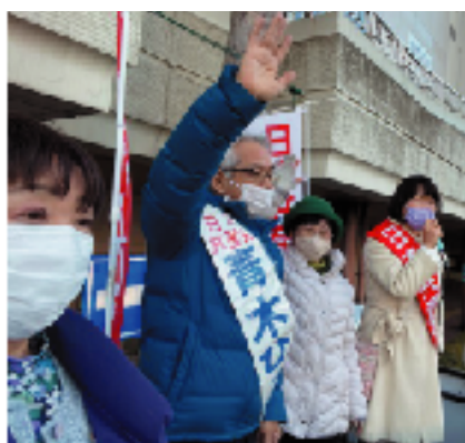
左から福田市議、青木候補、天谷市議、梅村候補の各氏

きたことが実り、高齢者・障がい者の入所施設や精神科病院の職員など2万9千人に抗原検査が行われることになった。声をあげれば変えられる」と報告。「米