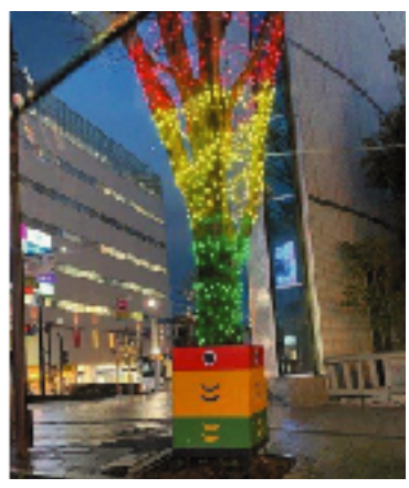
黄ふなのイルミネーション コロナ収束を願って