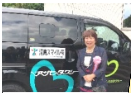
地元の福田議員も出発を祝う