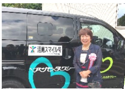
地元の福田議員も出発を祝う