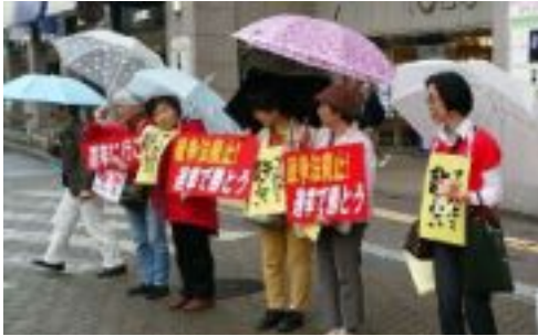
リレートークをする女性の皆さん