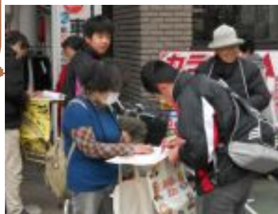
6・9行動で署名活動をする宇都宮原水協のみなさん

2016年度の活動方針では、「国民平和大行進」について、「今年も北から南へ歩き通すこと、1人でも多くの市民の参加をしていただくこと、実行委員会参加団体を増やし、幅広い団体が行進に参加すること」をめざすとしています。 また、毎月の6・9行動など創意ある日常の活動を強めることや、被爆者との連帯・援護活動をあげ、宇都宮市に対し、「原爆パネル・戦争と人間」の購入・展示・活用を求めていくとしています。